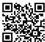
阿武隈STC郡山 ホームページ